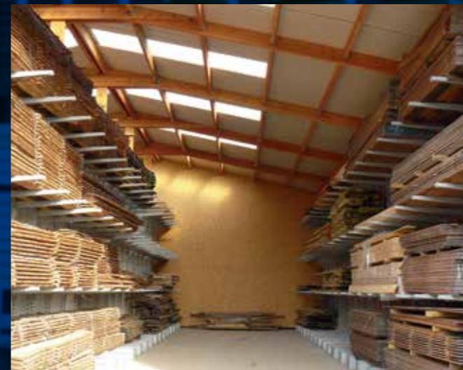
Autoportant pour billes de bois avec éclairage zénithal