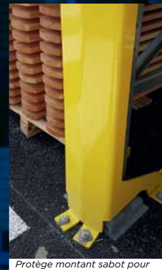
Protège montant sabot pour rack à palettes