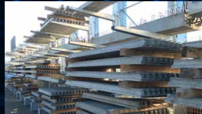
Cantilever extérieur pour stockage de poutres et poutrelles précontraintes