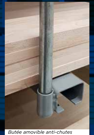
Butée amovible anti-chutes en extrémité de support