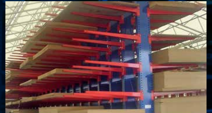
Cantilever double face lourds, stockage panneaux, centre de gravité déporté